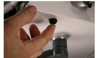
Figur 1: XO Konfigurationsschalter

Im Falle von 2 identischen Instrumenten (z.B. 2 Mikromotoren) wird die Konfiguration für beide gültig (z.B. Spraywassermenge).