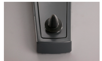
Figur 2: XO Joystick