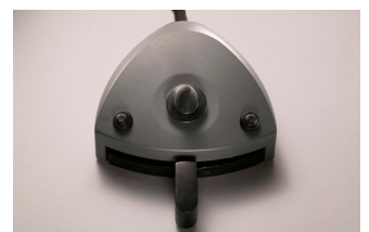
Figur 3: XO Fussanlasser